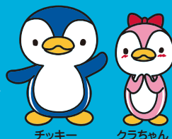
チッキー クラちゃん

「スマイルスポーツ」で取り上げてほしい という地域スポーツクラブを募集しています。 詳しくは地域スポーツクラブ担当 (03-5474-2148)まで。