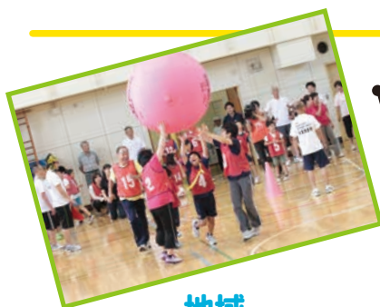
地域 コミュニケーション