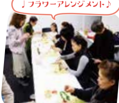
♪フラワーアレンジメント♪